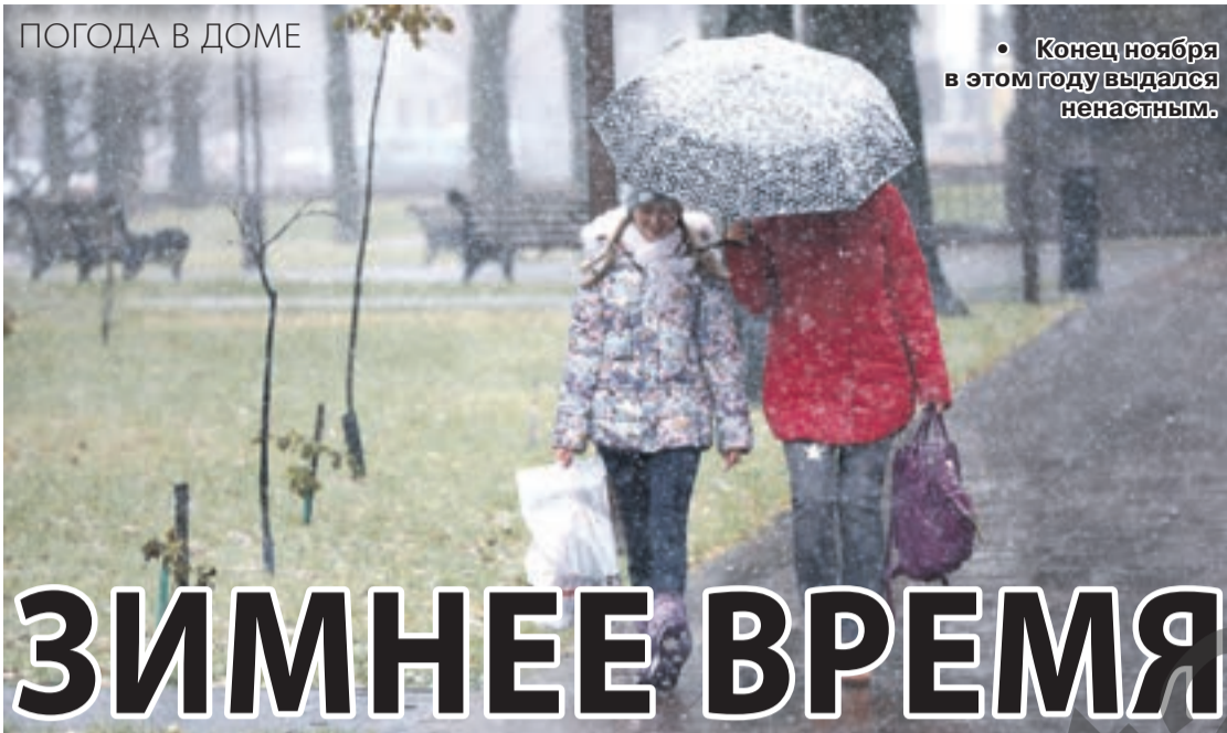
• Конец ноября в этом году выдался ненастным.